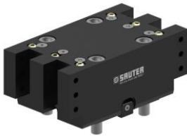
Werkzeughalter mit Vierkantaufnahme square tool holder