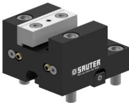
Werkzeughalter mit Vierkantaufnahme square tool holder