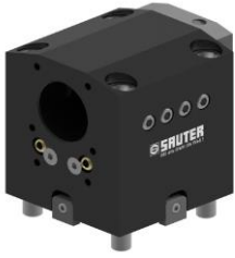
Bohrstangenhalter Boring bar holder