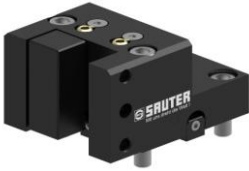
Werkzeughalter mit Vierkantaufnahme square tool holder