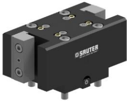
Werkzeughalter mit Vierkantaufnahme square tool holder