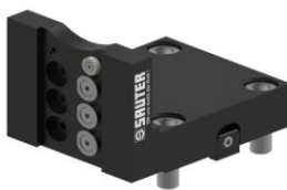
Abstechhalter für Stechklingen cut off tool holder